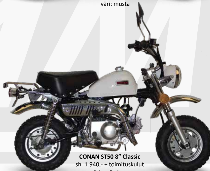
CONAN ST50 8'' Classic sh. 1.940,- + toimituskulut väri: valkoinen