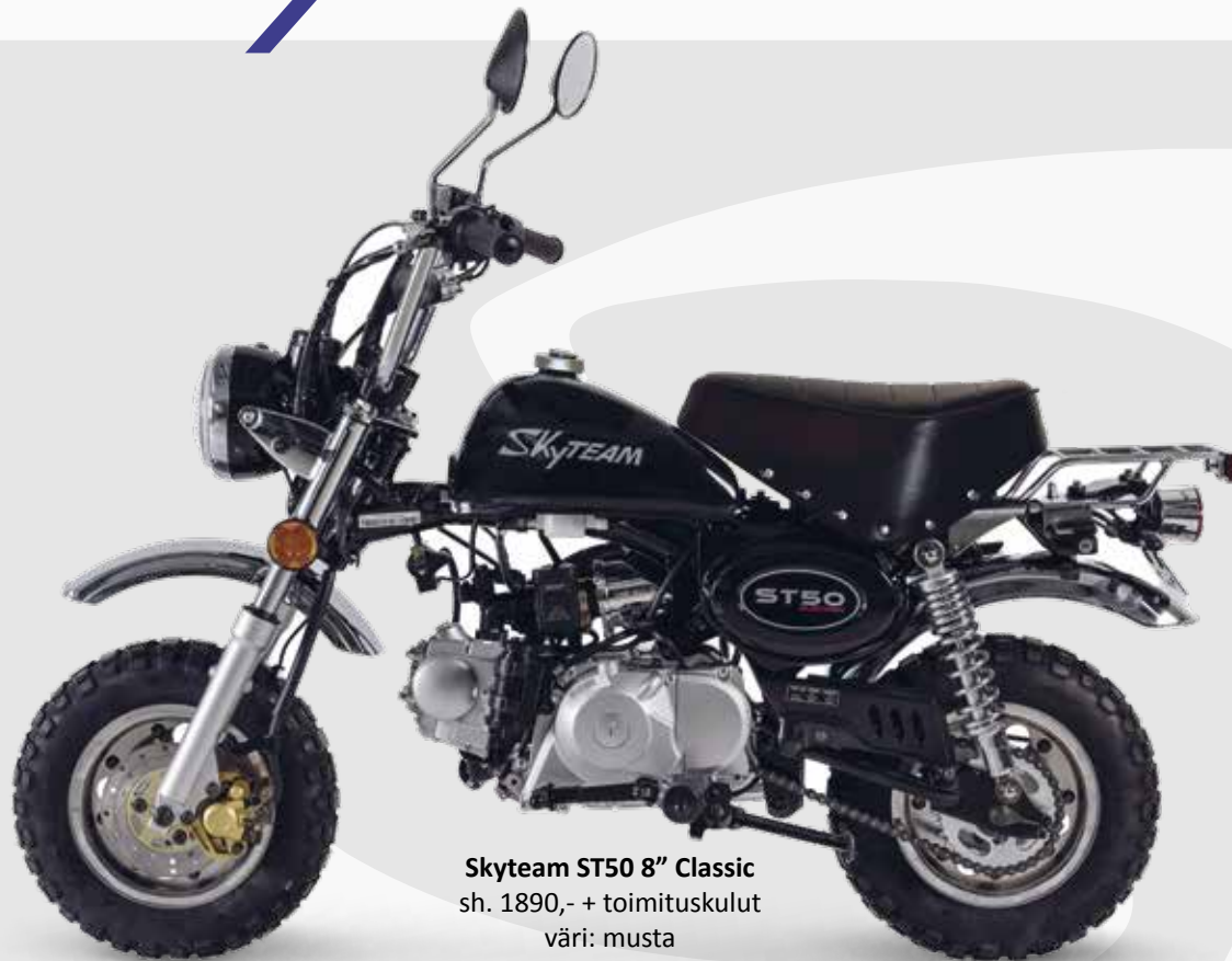
Skyteam ST50 8" Classic sh. 1890,- + toimituskulut väri: musta