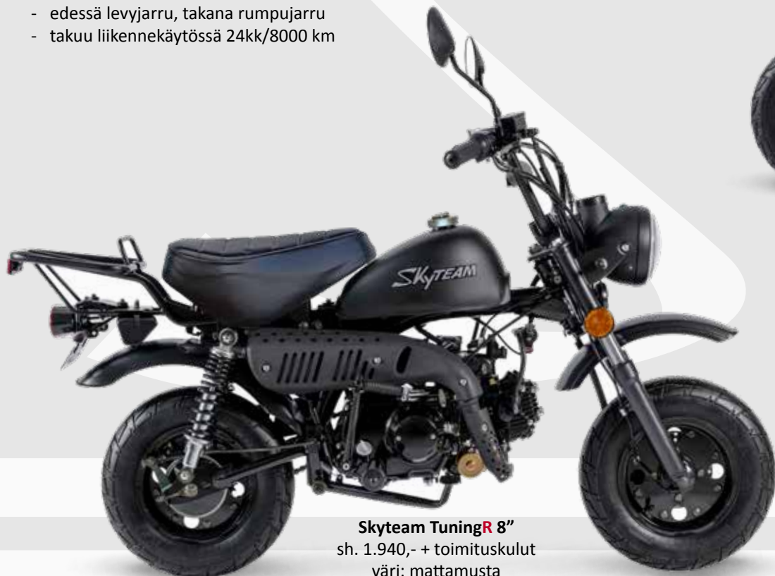
Skyteam TuningR 8" sh. 1.940,- + toimituskulut väri: mattamusta