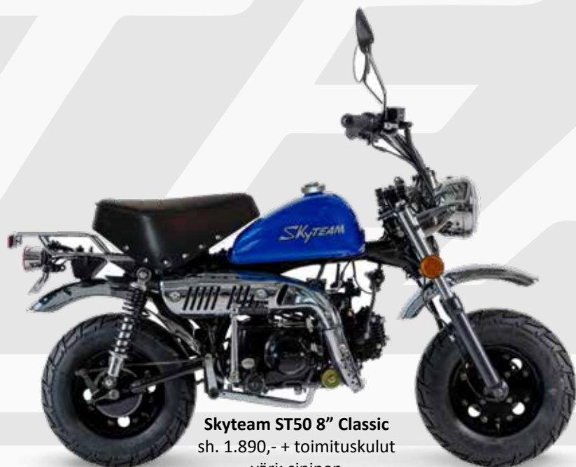
Skyteam ST50 8'' Classic sh. 1.890,- + toimituskulut väri: sininen