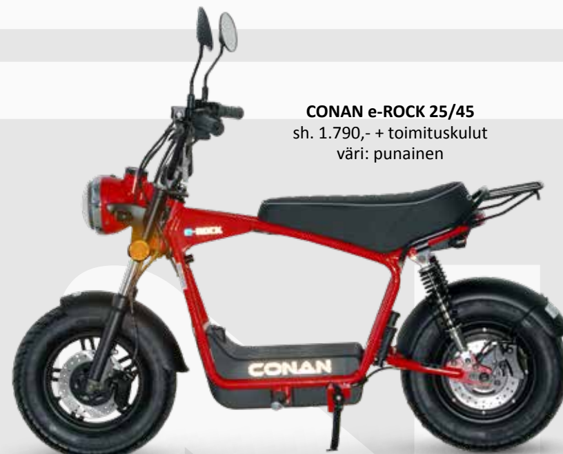
CONAN e-ROCK 25/45 sh. 1.790,- + toimituskulut väri: punainen