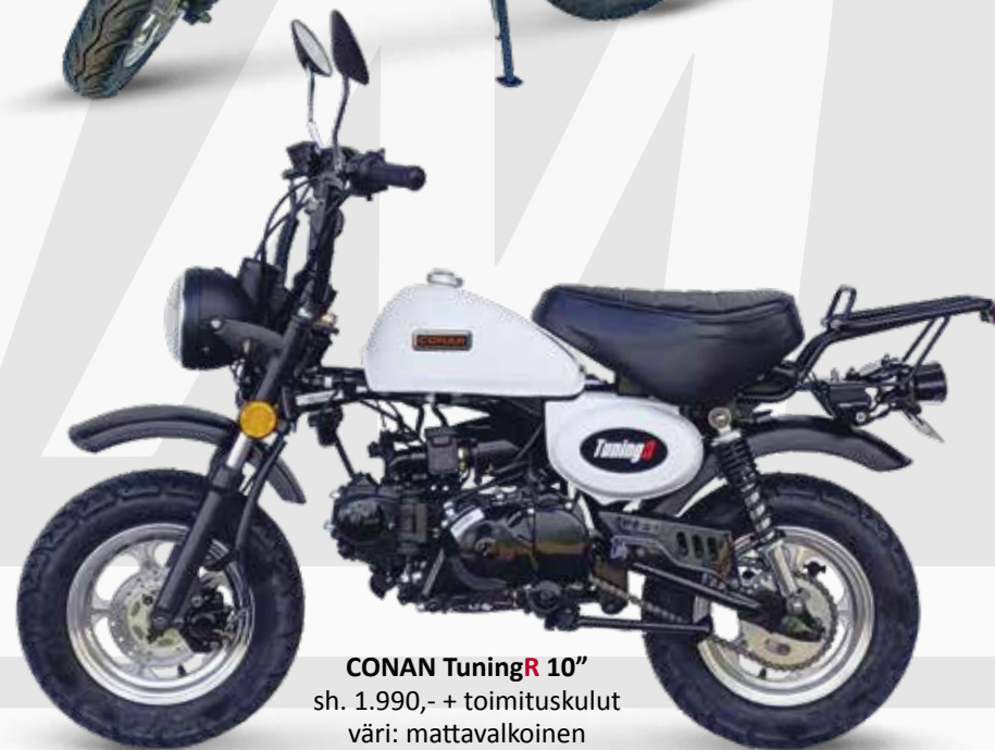
CONAN TuningR 10" sh. 1.990,- + toimituskulut väri: mattavalkoinen