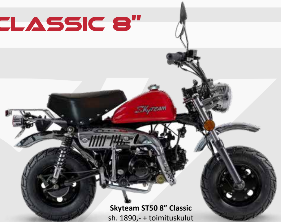
Skyteam ST50 8" Classic sh. 1890,- + toimituskulut väri: punainen