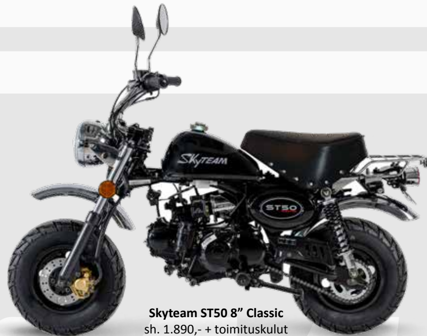
Skyteam ST50 8'' Classic sh. 1.890,- + toimituskulut väri: musta

Kaudella 2025 osa Suomessa myytävistä Skyteam /Conan -mopoista on valmistettu vuonna 2024 (EURO5)