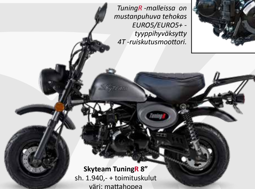
Skyteam TuningR 8" sh. 1.940,- + toimituskulut väri: mattahoepa

TuningR -malleissa on mustanpuhuva tehokas EURO5/EURO5+ - tyyppi hyväksytty 4T -ruiskutusmoottori.