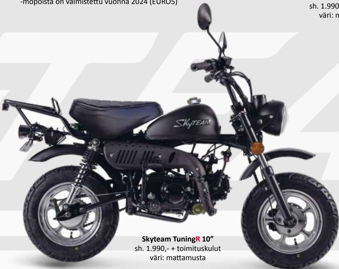
Skyteam TuningR 10" sh. 1.990,- + toimituskulut väri: mattamusta