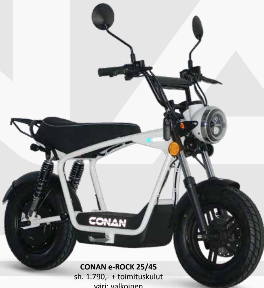
CONAN e-ROCK 25/45 sh. 1.790,- + toimituskulut väri: valkoinen